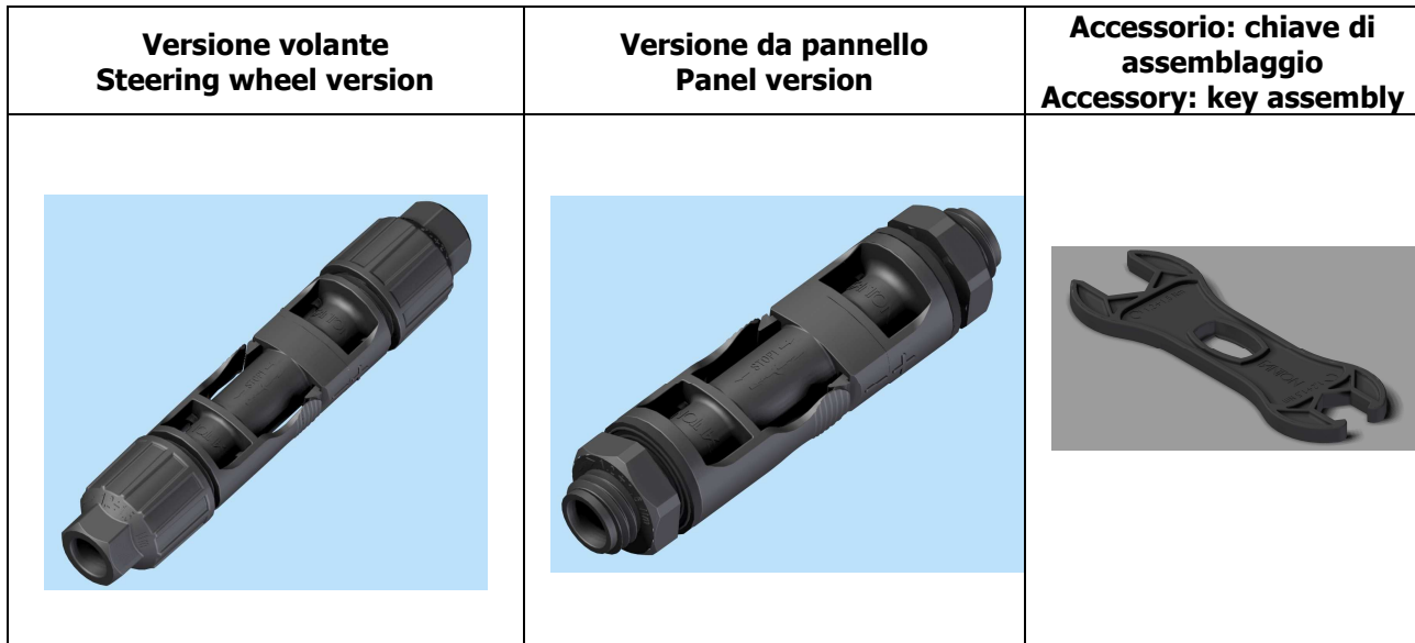
TABLE 1 (codes) / Tabella 1 (codifica)